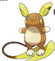
Raichu de Alola